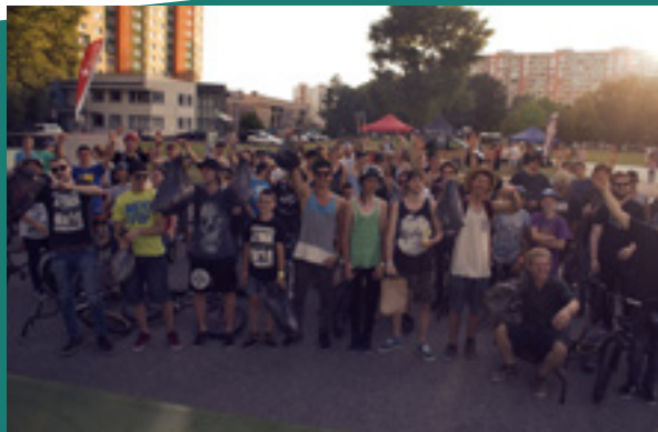
Concrete Jungle Jam